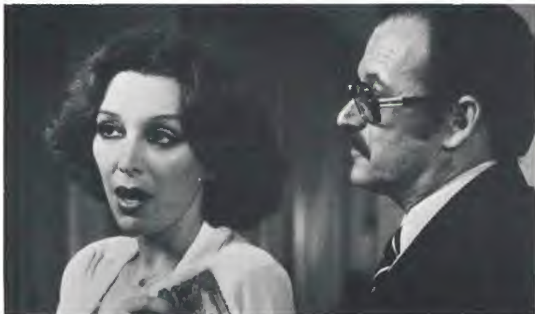
Esperanza Roy - Agustín González